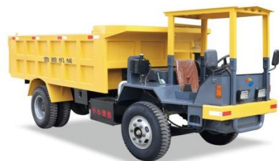
02 UQ-10 矿用自卸车