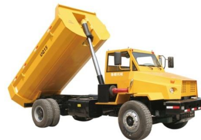
03 UQ-15 矿用自卸车