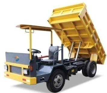
01 UQ-5 矿用自卸车